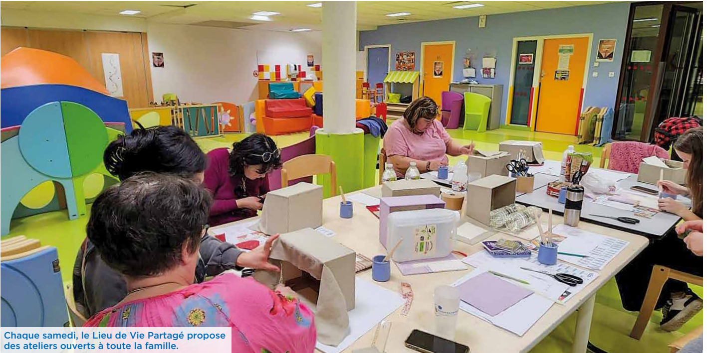
Chaque samedi, le Lieu de Vie Partagé propose des ateliers ouverts à toute la famille.

La municipalité a fait le choix de regrouper à La Passerelle son action en faveur de la jeunesse et de la parentalité. Le « Centre Animation Jeunesse et Famille » (CAJF) réunit ainsi, au sein d'une même direction, cette vision au sens large, agissant aussi bien en matière d'animation, de réussite éducative, de parentalité, d'emploi ou encore d'insertion.