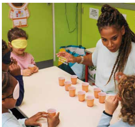
Semaine du handicap : journée de sensibilisation des maternelles