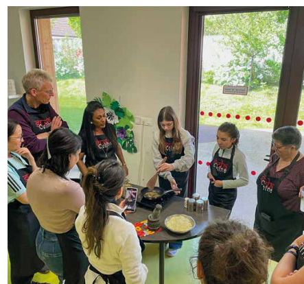
Atelier cuisine indienne