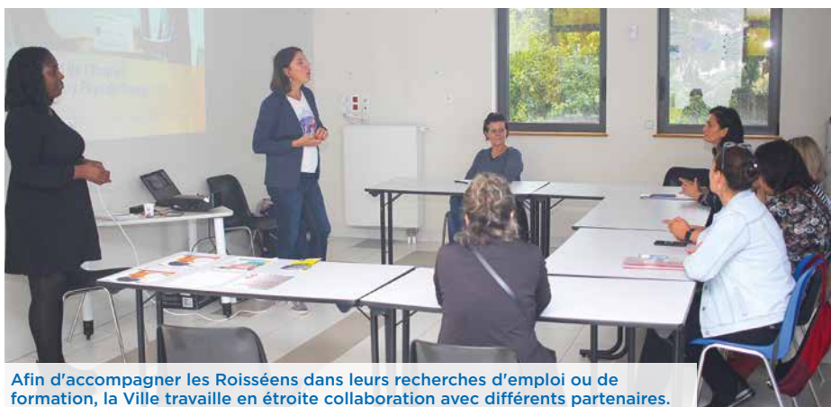
Afin d'accompagner les Roisséens dans leurs recherches d'emploi ou de formation, la Ville travaille en étroite collaboration avec différents partenaires.